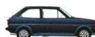
Fiesta XR 2

Ergänzungen gegenüber dem L-Modell 3-Punkt-Armlehne ; Handschuhfach mit Deckel und Beleuchtung ; von innen verstellbarer Außenspiegel (Fahrerseite) .