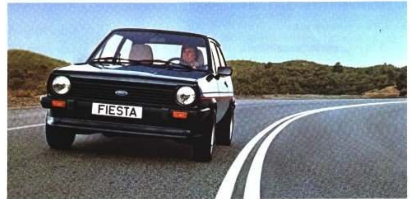
Ford Fiesta XR 2. Stuhlstangenhörner Sonderausstattung.

Angetrieben wird der XR 2 von einer 1,6-Liter-Maschine (62 kW/84 PS) mit kontaktloser Transistorzündung. Ein Triebwerk, das ihn rasant beschleunigt und auf eine respektable Spitzengeschwindigkeit bringt. So viel Kraft verlangt natürlich auch nach einem speziellen Fahrwerk. Das Fahrwerk des XR 2 ist serienmäßig spurverbreitert. Für den XR 2 wurde die Dämpfer-Federabstimmung speziell berechnet und für höhere Geschwindigkeiten sowie das Fahren im Grenzbereich abgestimmt. 6 J x 13-Zoll-Leichtmetall-Felgen halten das Gewicht der ungefederten Massen gering. Und die 185/60 Niederquerschnittreifen verhelfen zu sicherem Kontakt zur Fahrbahn. Die Bremsanlage wurde optimiert: Die innenbelüfteten Scheibenbremsen vorn sind für stärkste Belastungen ausgelegt.