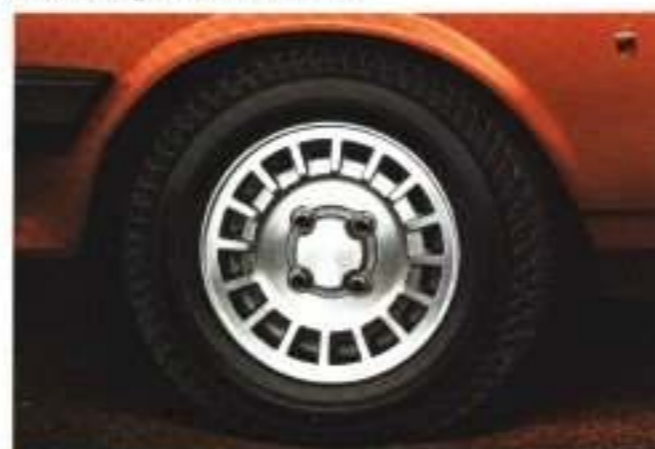
Leichtmetalleigen – schön und funktional