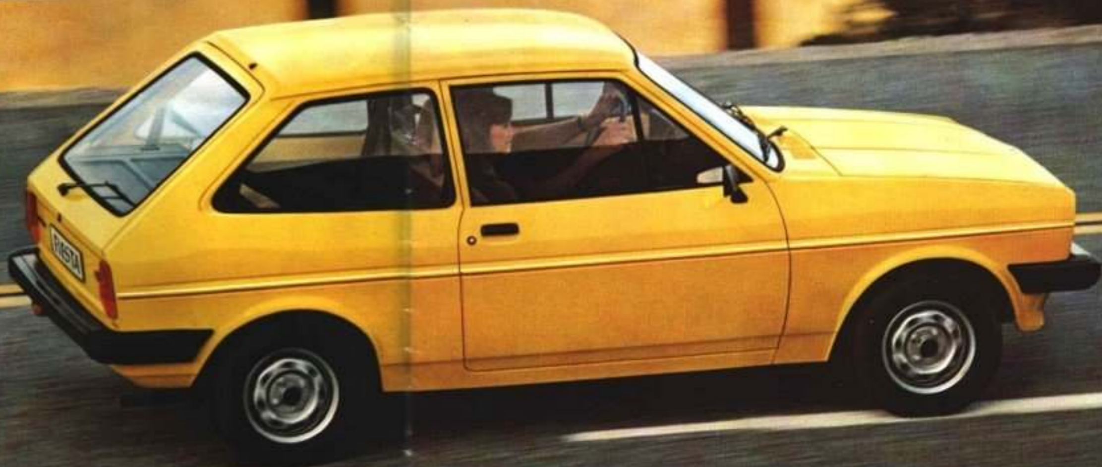
Fiesta Grundmodell 2. Außenspiegel (Beifahrerseite) Sonderausstattung.

Zweikreis-Bremssystem und Bremskraftverstärker ausgerüstet: Scheibenbremsen vorn (beim XR 2 der Motorleistung angepaßt: innenbelüftet) und selbstnachstellende Trommelbremsen hinten.