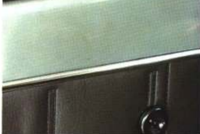
Radio P 22 D in Mittelkonsole mit Zettler