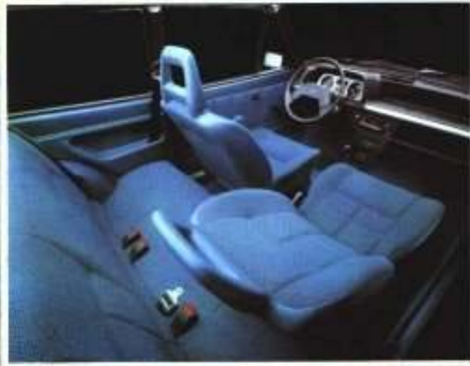
Innenraum Ford Fiesta L, Radio Sonderausstattung