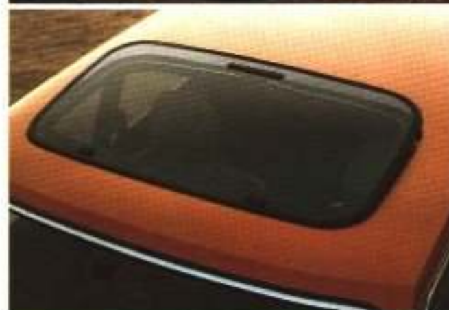
Panoramadach in getöntem Sicherheitsglas – auch hinten hochsteilbar.