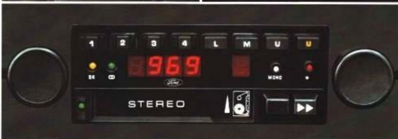
Stereo Radio: Stereo-Cassettengerät ESRT 32 DP5 mit digitaler Frequenzanzeige und elektronischem Senderschlaf.