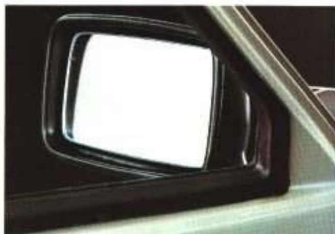
Mit innen verstellbarer Außenspiegel – bequemere und raschere Einstellung.

Ob Ihr Ford Fiesta das beliebte transparente Panoramadach, eine Scheinwerfer-Waschanlage haben soll oder beheizte Sitze oder eine elektrische Antenne. Oder auch „nur“ bequeme Kopfstützenpolster.